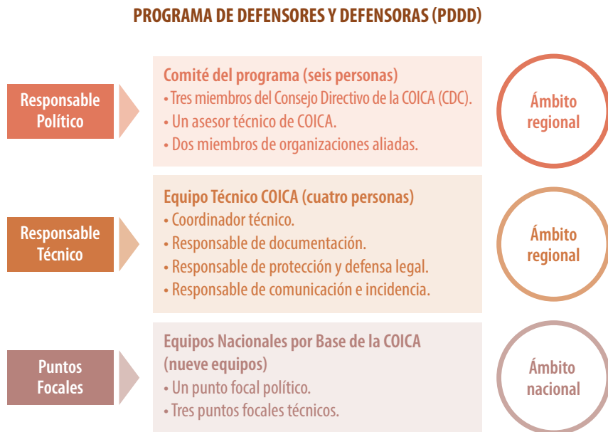
Figura N° 2. Propuesta de organización del Programa de Defensa de Defensores y Defensoras Indígenas