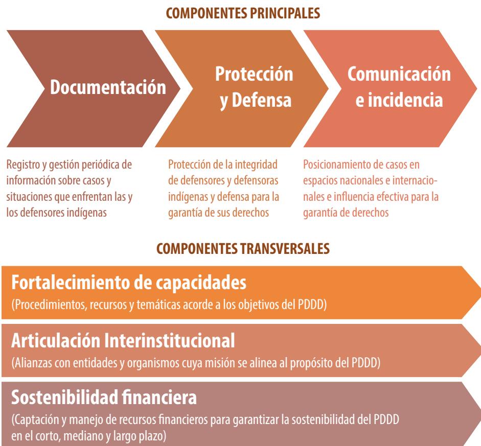
Figura N° 1. Componentes del PDDD