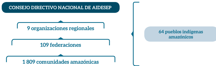
Gráfico 1: Composición de la Asociación Interétnica de Desarrollo de la Selva Peruana